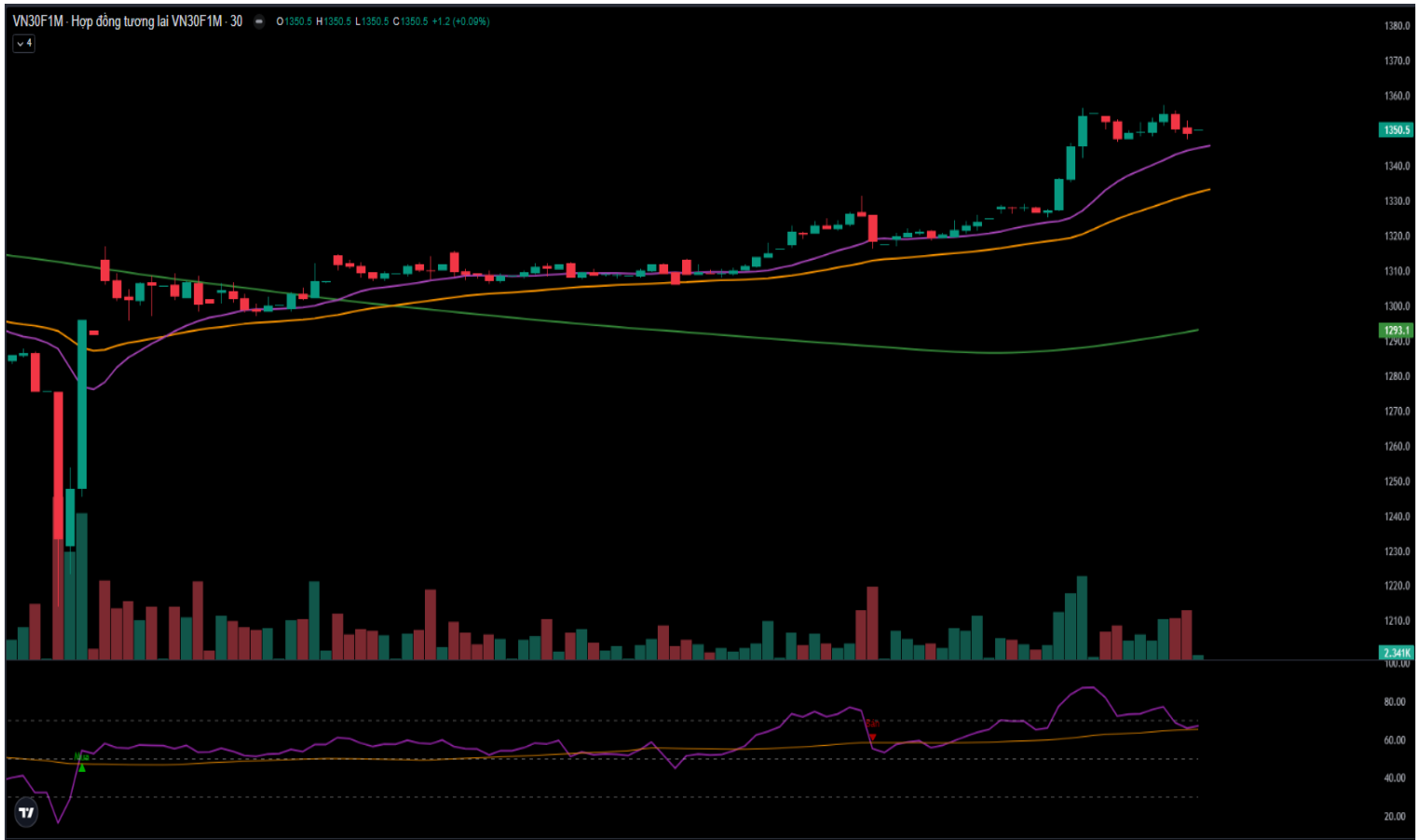
Hình 5- Chỉ số VN30F1M theo khung 30 phút