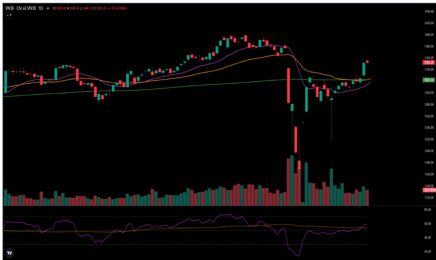
Hình 3- Chỉ số VN30 cơ sở theo ngày

Bên cạnh đó, VN30-Index cắt lên trên nhóm đường SMA 100 ngày và SMA 200 ngày trong bối cảnh chỉ báo MACD đang không ngừng mở rộng khoảng cách với đường Signal sau khi cho tín hiệu mua trước đó cho thấy triển vọng lạc quan trung và dài hạn dần hiện hữu.