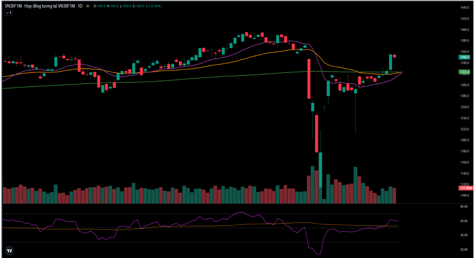
Hình 4- Chỉ số VN30F1M theo khung ngày