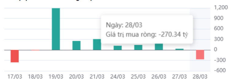
Giá trị tự doanh mua ròng 10 phiên

* Dữ liệu tự doanh được tổng hợp hàng ngày sau phiên giao dịch