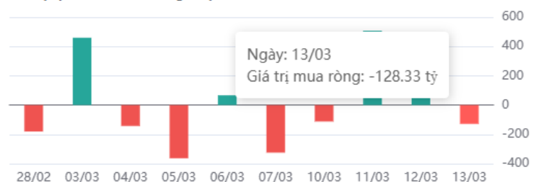
Giá trị tự doanh mua ròng 10 phiên

* Dữ liệu tự doanh được tổng hợp hàng ngày sau phiên giao dịch