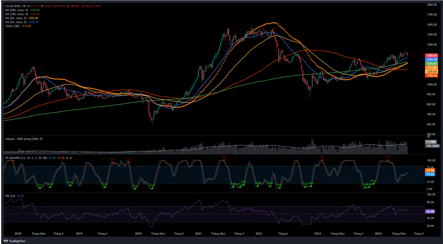
Hình 3- Chỉ số VN30 cơ sở theo ngày

Bên cạnh đó, VN30-Index đang test lại ngưỡng Fibonacci Projection 61.8% (tương đương vùng 1,270-1,295 điểm) trong bối cảnh chỉ báo MACD tiếp tục hướng đi xuống sau khi cho tín hiệu bán trước đó. Nếu tín hiệu bán được duy trì và chỉ số rơi khỏi vùng hỗ trợ này thì rủi ro điều chỉnh sẽ tăng cao trong các phiên tới.