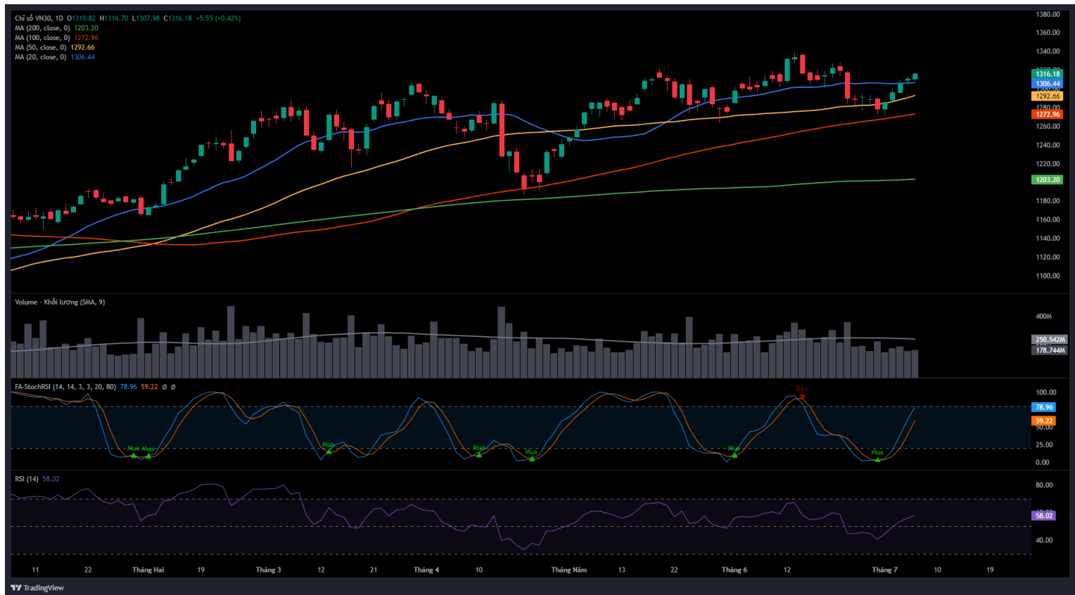
Hình 3- Chỉ số VN30 cơ sở theo ngày

Thêm vào đó, chỉ số tiếp tục tăng điểm sau khi test thành công ngưỡng Fibonacci Projection 61.8% (tương đương vùng 1,270-1,295 điểm) trong bối cảnh chỉ báo MACD cho tín hiệu mua trở lại càng củng cố thêm sức mạnh cho xu hướng hiện tại.