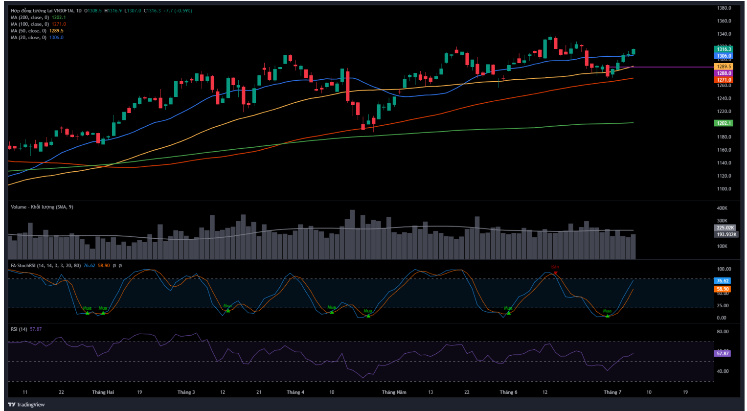
Hình 4- Chỉ số VN30F1M theo khung ngày