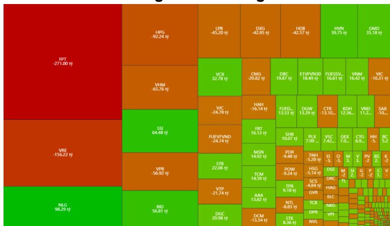
Hình 1- Phân bổ dòng tiền Nước ngoài