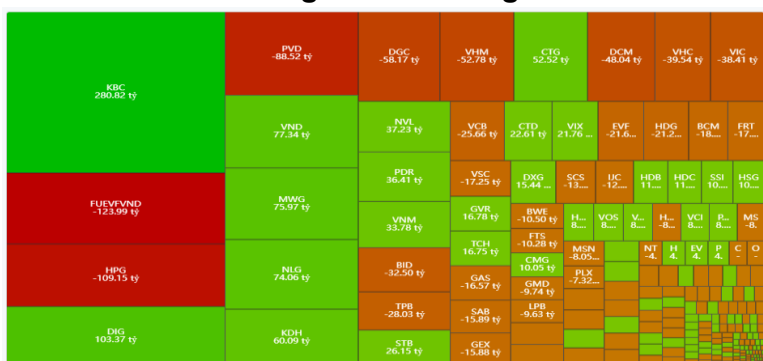
Hình 1- Phân bổ dòng tiền Nước ngoài