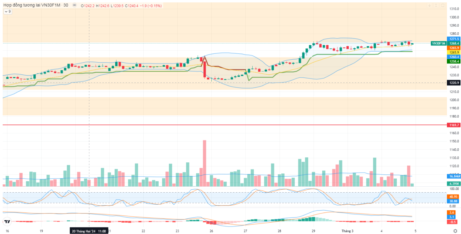
Hình 5- Hợp đồng VN30F1M theo 30 phút