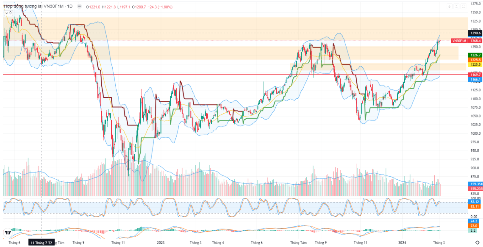
Hình 4- Hợp đồng VN30F1M theo khung ngày