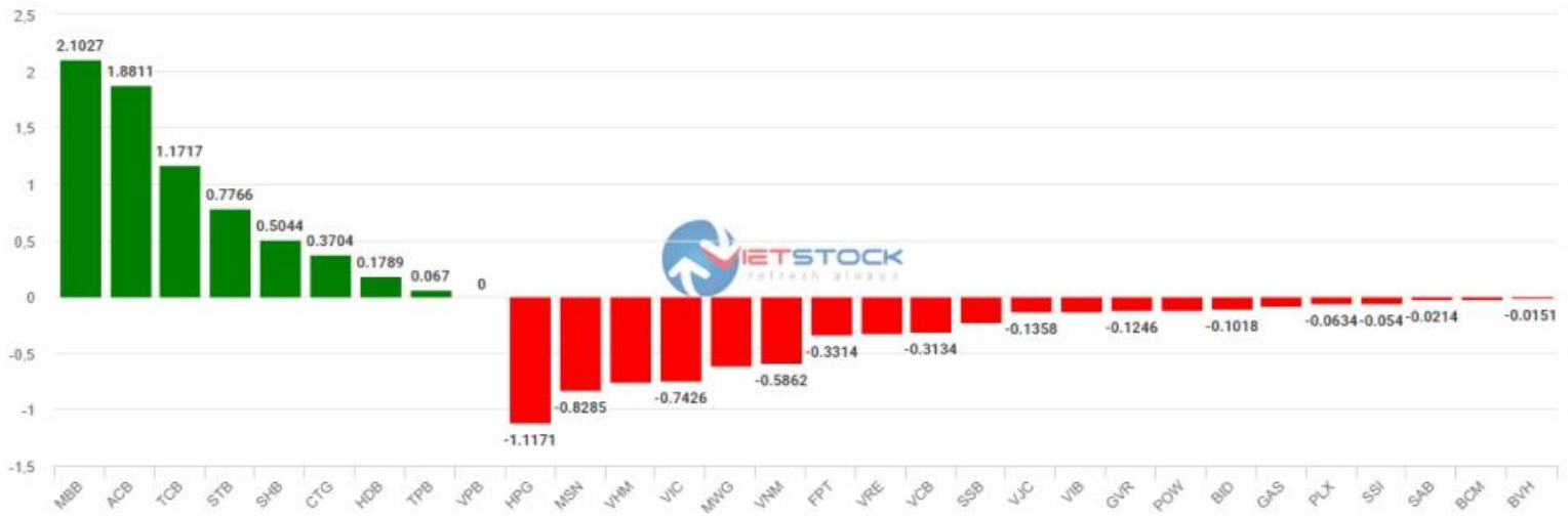
Hình 6- Cổ phiếu ảnh hưởng trong VN30-Index