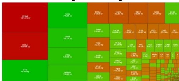
Hình 1- Phân bổ dòng tiền Nước ngoài