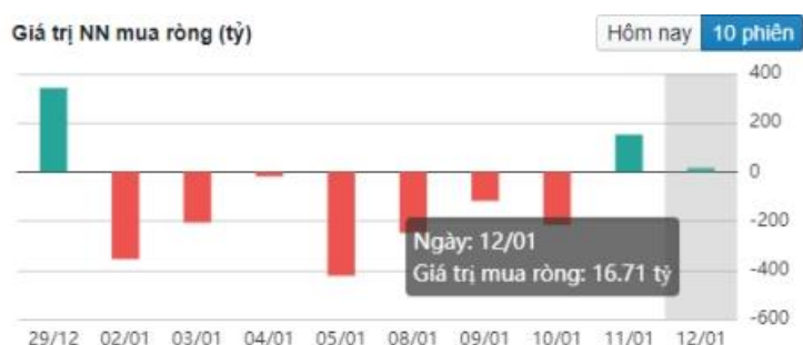
Hình 2- Giá trị Nước ngoài mua ròng (tỷ)