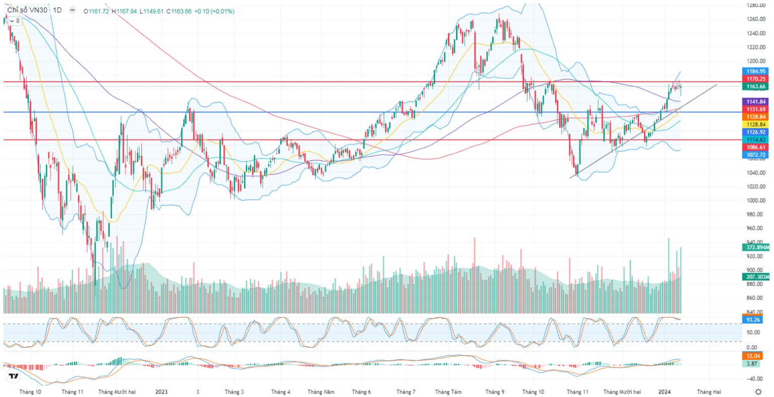
Hình 3- Chỉ số VN30 cơ sở theo ngày

- Chỉ số duy trì đóng cửa trên MA100 (1141.8) và MA200 (1131) khung Daily và đang tiệm cận đến vùng đỉnh cũ gần nhất trước đó quanh 1170-1172, liên tục tại động thái rút chân trước đó khi tiệm cận vùng này. Ở chiều tích cực, đã có sự hồi phục và kiểm định thành công khu vực 1145 (MA100) và vượt khu vực 1165. Kịch bản bị bán lại từ vùng 1167-1172, phá vỡ vùng 1138, chỉ số sẽ phá vỡ vùng cân bằng trước đó về các vùng hỗ trợ dưới quanh 1108, xa hơn là 1090. Trường hợp, chỉ số kiểm định thành công vùng 1167-1170, sẽ tiếp diễn và hướng lên vùng 1172-1175.