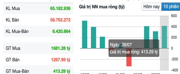
Hình 2- Giá trị Nước ngoài mua ròng (tỷ)