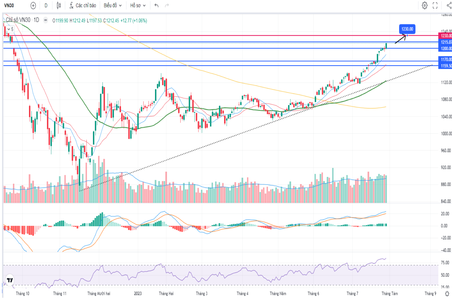
Hình 3- Chỉ số VN30 cơ sở theo ngày

- Các chỉ báo kỹ thuật như RSI và ADX cũng cho thấy sự đồng thuận khi vẫn thể hiện sức mạnh tích cực. Với tín hiệu nầy, có khả năng VN30-Index sẽ tiếp tục được hỗ trợ và hướng đến vùng cản quanh 1,220-1,230 điểm trong thời gian tới.