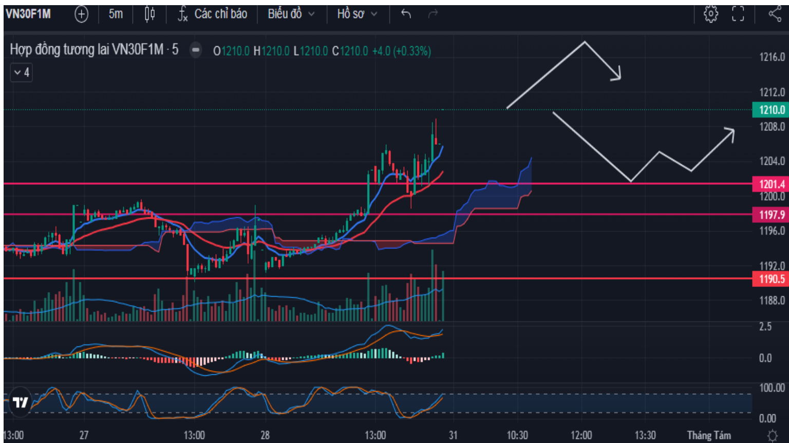
Hình 5- Hợp đồng VN30F1M theo 5 phút