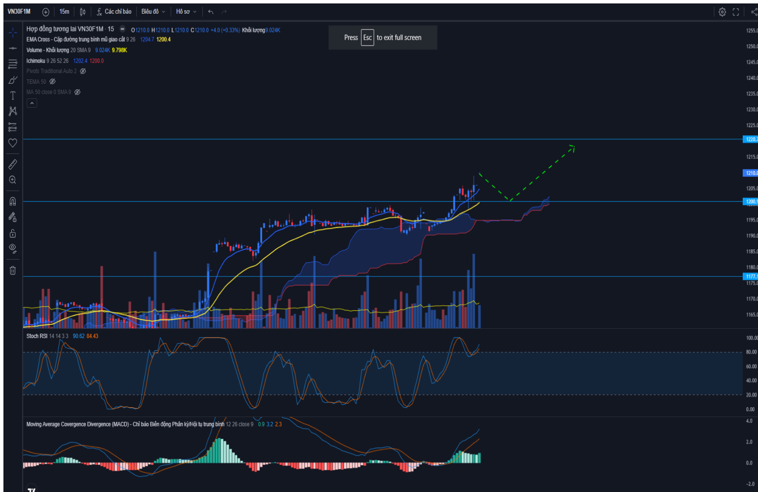
Hình 4- Hợp đồng VN30F1M theo 15 phút