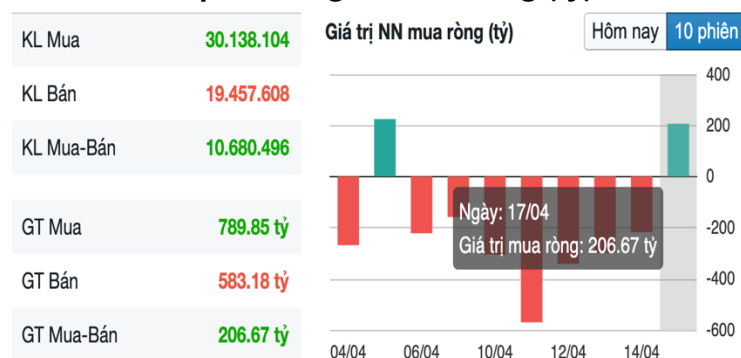
Hình 2- Giá trị Nước ngoài mua ròng (tỷ)