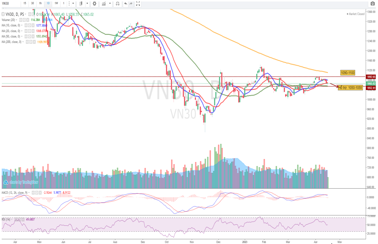
Hình 3- Chỉ số VN30 cơ sở theo ngày

- Mặc dù hạn chế biên độ giảm so với mức thấp nhất trong phiên tuy nhiên chỉ số đóng cửa dưới MA 20 ngày. Trong ngắn hạn, mặc dù quán tính điều chỉnh có thể duy trì với vùng hỗ trợ gần quanh MA50 (1054 – 1055 điểm) tuy nhiên trạng thái đi ngang kể từ đầu năm của VN30 vẫn đang được duy trì. Kênh giá vận động chủ yếu của chỉ số kể từ đầu năm 2023 là 1010 – 1100.