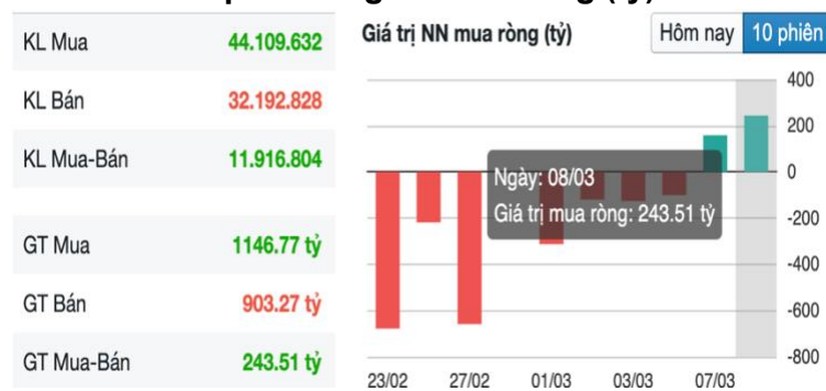
Hình 2- Giá trị Nước ngoài mua ròng (tỷ)