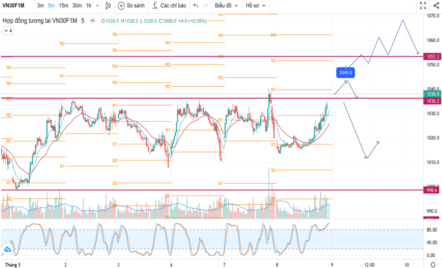
Hình 5- Hợp đồng VN30F1M theo 5 phút