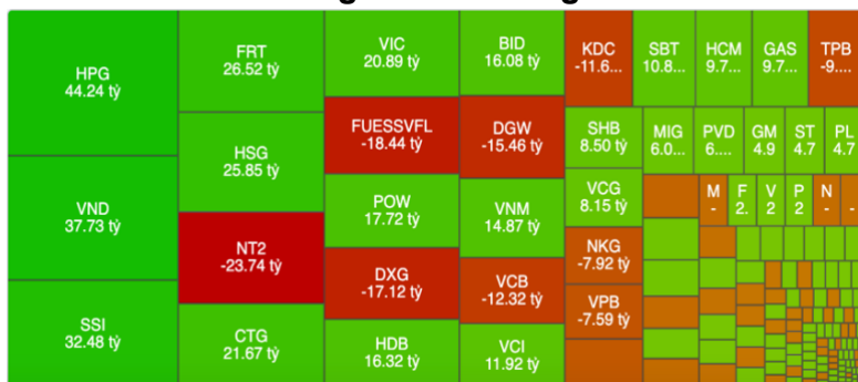
Hình 1- Phân bổ dòng tiền Nước ngoài