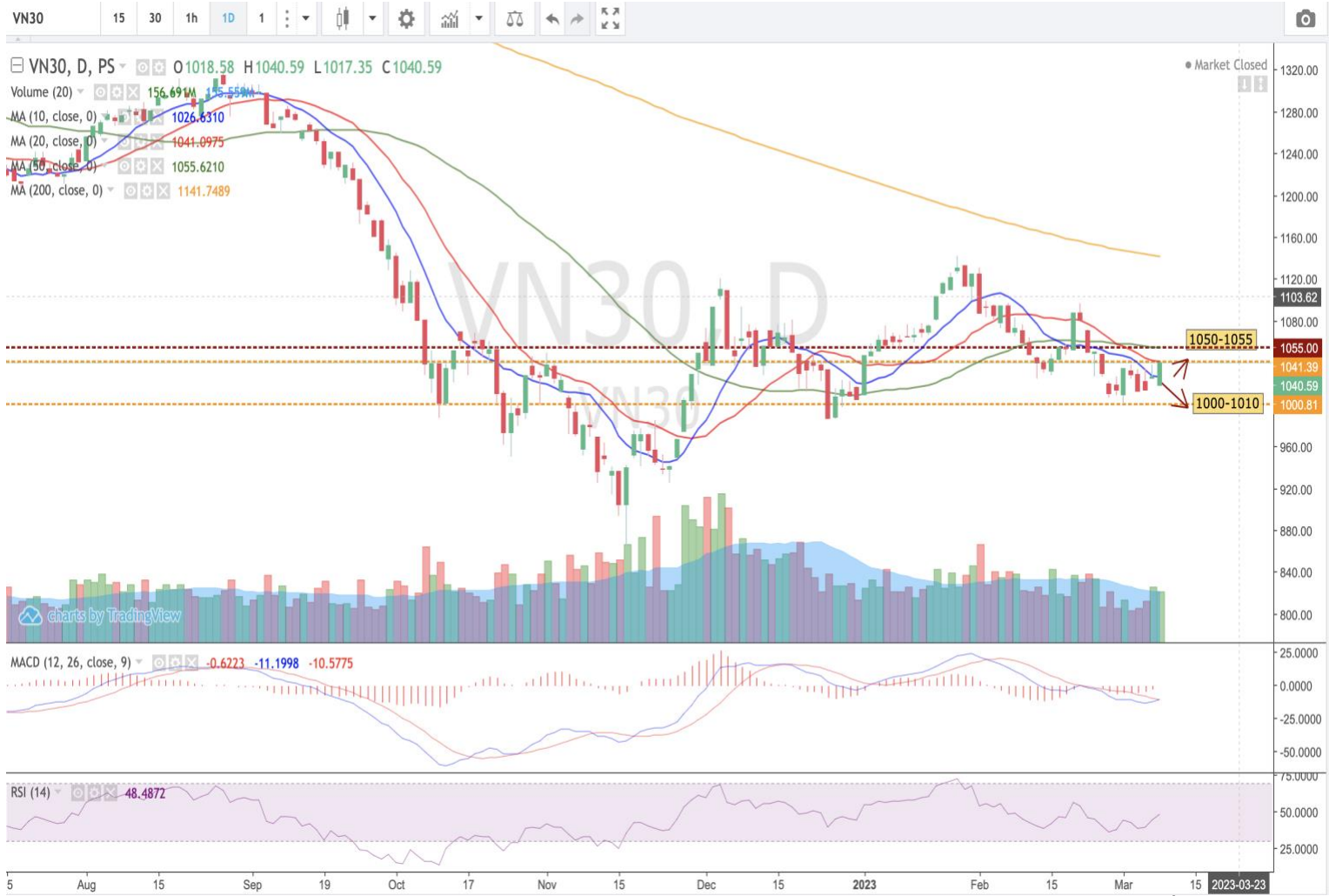
Hình 3- Chỉ số VN30 cơ sở theo ngày