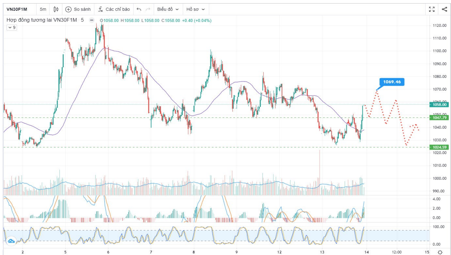
Hình 5- Hợp đồng VN30F1M theo 5 phút