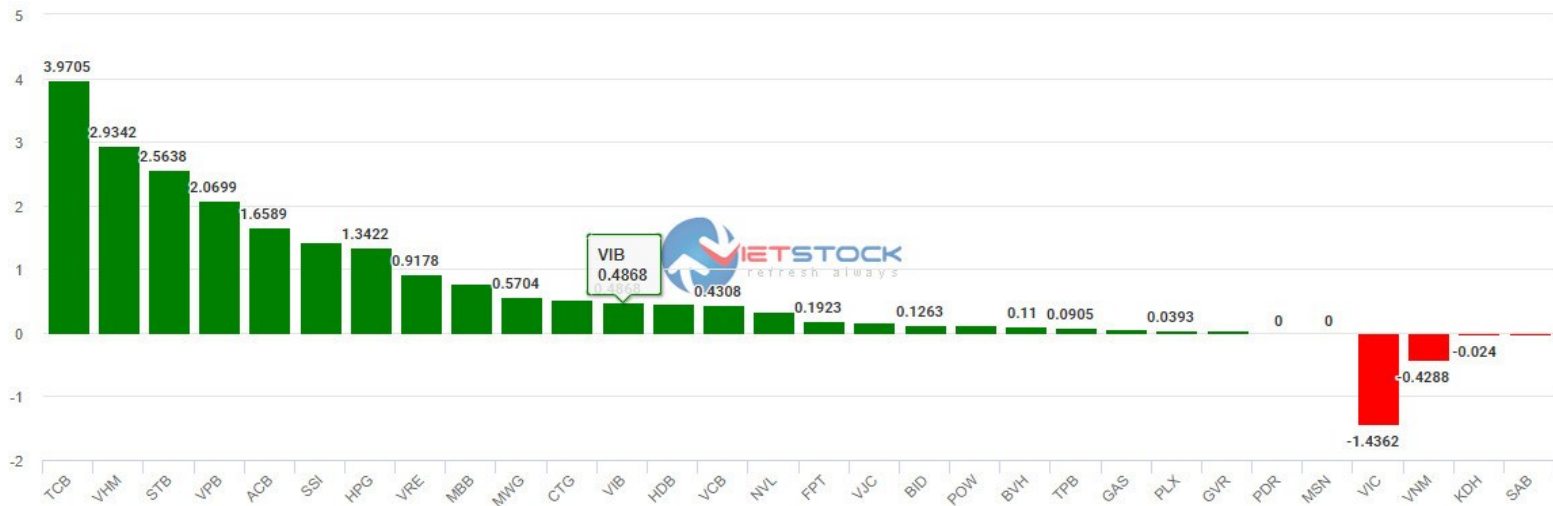
Hình 6- Cổ phiếu ảnh hưởng trong VN30-Index