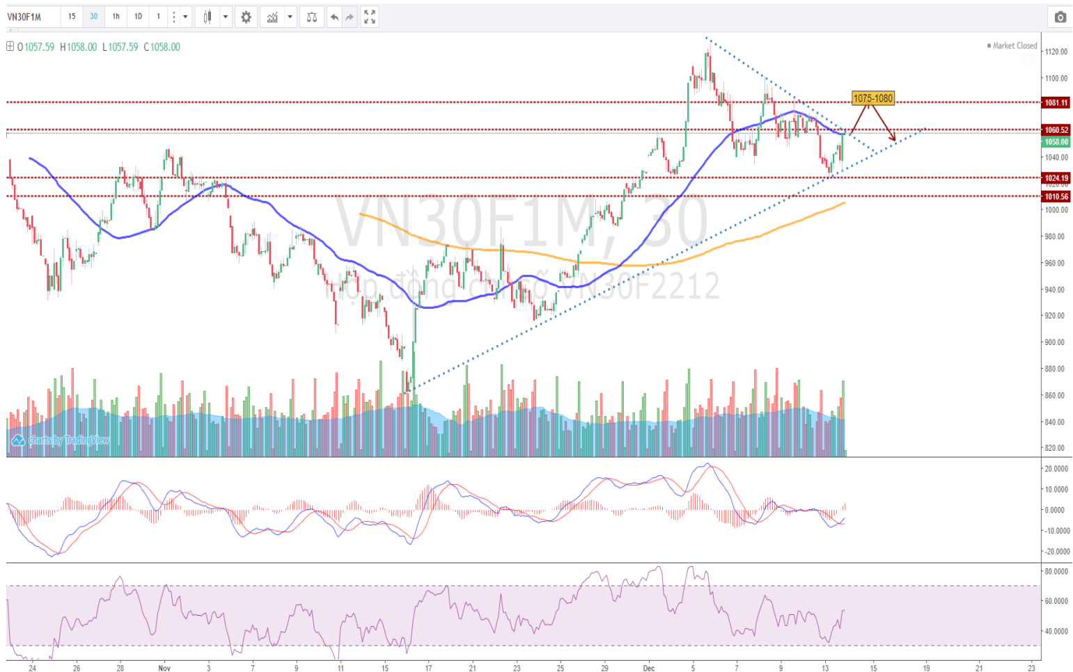
Hình 4- Hợp đồng VN30F1M theo 15 phút